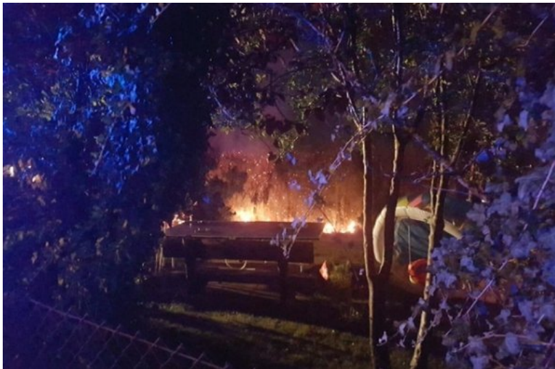
La haie qui a pris feu.

Une haie a pris feu près d'une maison, dans un quartier résidentiel de Posieux. Un engin pyrotechnique allumé dans le jardin est à l'origine de l'incendie.